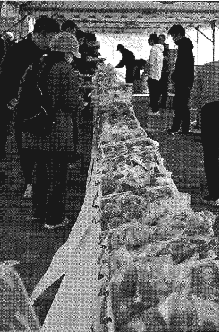
会場テント内の様子