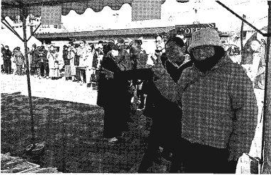
開場約30分前から列を作る来場者